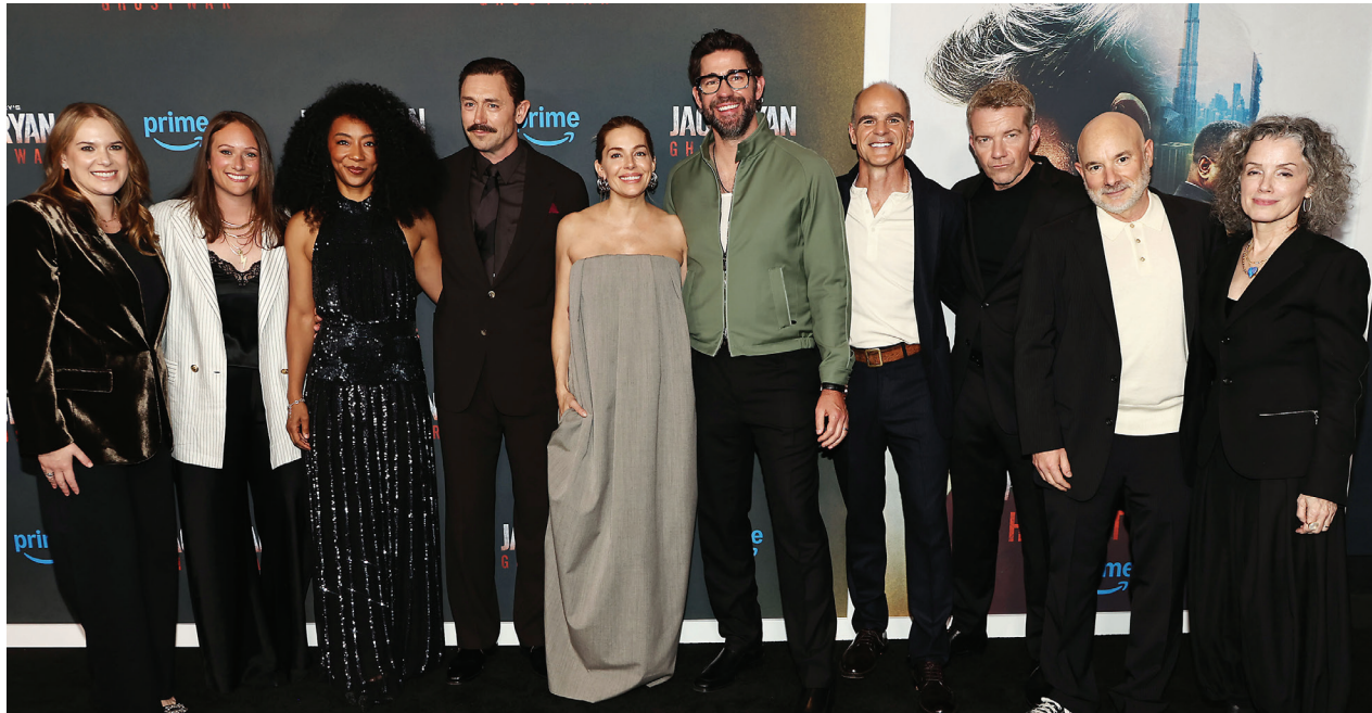
El elenco de “Jack Ryan: Ghost War” en la carpeta roja.

“Creo que lo interesante de Ghost War es que Jack siente que ya no necesita esto, pero claramente hay algo que lo está trayendo de vuel-