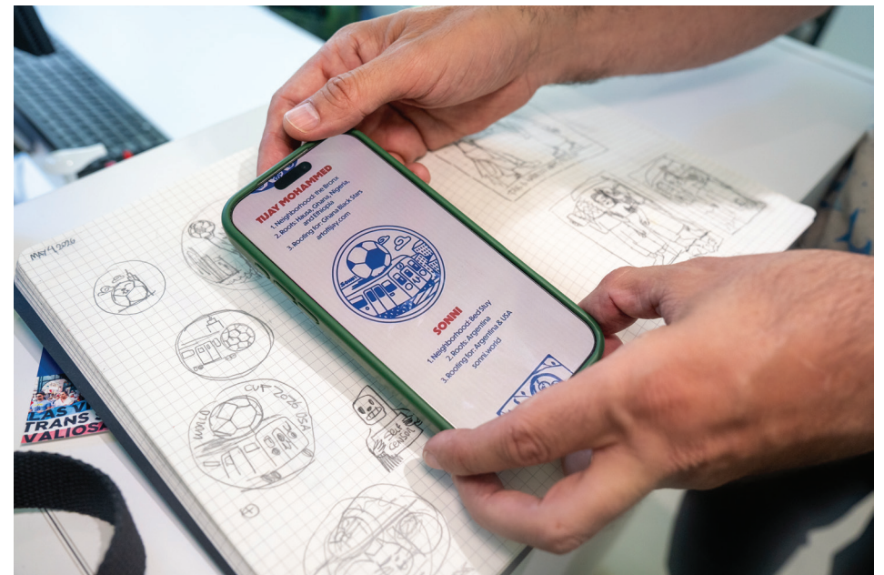
Los sellos del programa 'World Cup '26 NYC Neighborhood Passport', una iniciativa destinada a acercar a turistas y residentes a los barrios de la ciudad durante la Copa Mundial de Fútbol de 2026.

Los sellos que componen el pasaporte fueron encargados a cinco artistas locales. Uno de los encargados de la iconografía es el ilustrador y