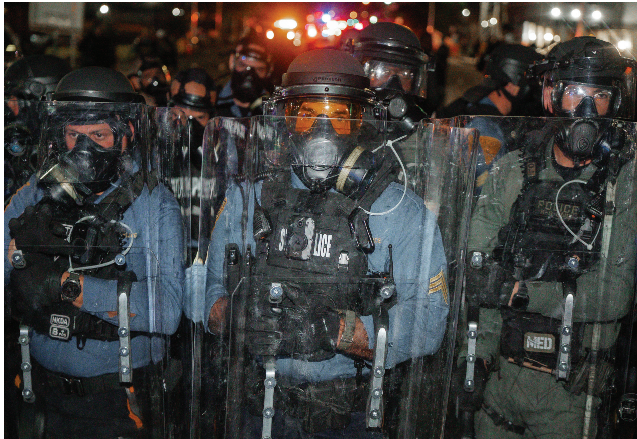
Protestas, huelga de hambre y enfrentamientos frente al centro de detención de inmigrantes en Nueva Jersey.

Delaney Hall se encuentra en la zona industrial de Newark y es operado por la empresa privada GEO Group bajo contrato con el gobierno federal. La instalación tiene capacidad para albergar aproximadamente mil detenidos y ha sido utilizada por el Servicio de Inmigración y Control de Aduanas (ICE) como uno de los principales centros de procesamiento y detención de inmigrantes en la región noreste del país. En las últimas semanas, sin embargo, la atención nacional se ha concentrado en el lugar después de que cientos de detenidos iniciaran una huelga de ham-