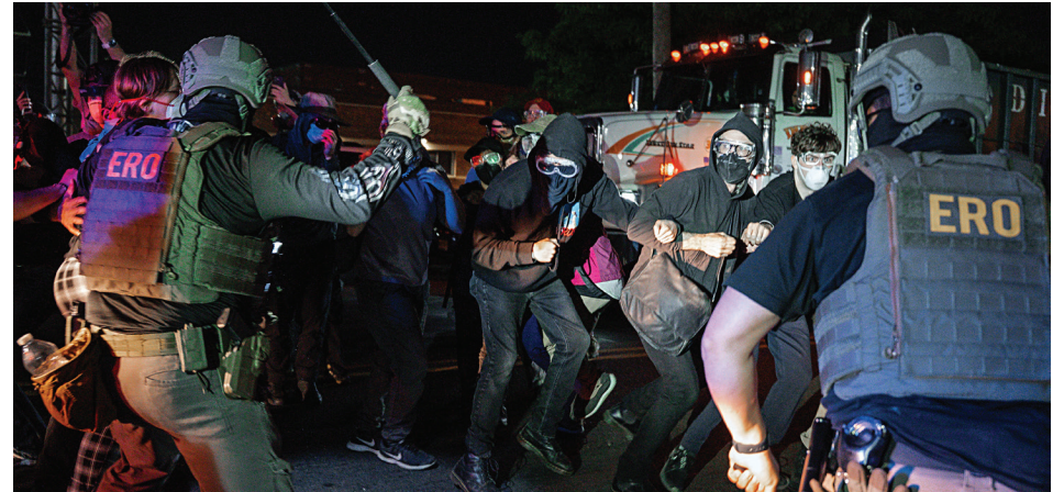
Agentes del Servicio de ICE golpean con bastones a manifestantes mientras intentan bloquear vehículos que presuntamente transportaban detenidos para impedir su salida durante una protesta contra el trato a los inmigrantes detenidos en el Centro de Detención Delaney Hall.

Decenas de inmigrantes en el centro de detención Delaney Hall, en Nueva Jersey, continúan este martes su huelga de hambre y de trabajo por quinto día consecutivo, después de que el fin de semana se registraran enfrentamientos entre manifestantes que mantienen una vigilia frente a la instalación y agentes del Servicio de Inmigración y Control de Aduanas (ICE).