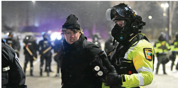
Un manifestante es detenido por la policía estatal durante una protesta masiva, mientras al fondo se observan filas de agentes antimotines desplegados en la ciudad.