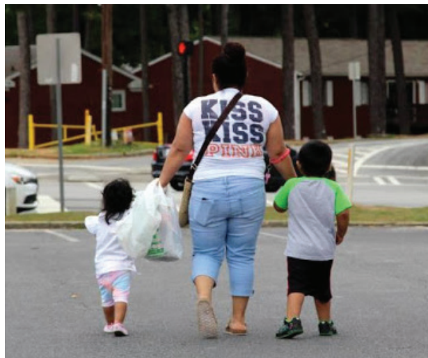
Según un estudio de 1800Migrante, al menos 37.088 niños y niñas han desaparecido tras ser entregados a personas que no tenían relación con ellos.

El Times publicó los datos "en bruto", sin procesarlos con la intención de "ponerlas a disposición del público, para un uso amplio y no comercial por parte de historiadores, investigadores, responsables políticos y medios de comunicación", recu-