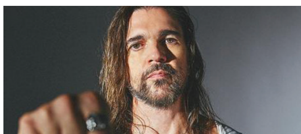
Juanes recibirá el 'Premio lo nuestro a la trayectoria', en honor a una carrera "marcada por la autenticidad, la evolución constante y una profunda conexión con sus raíces".

El cantante colombiano, autor de éxitos como 'La ca-