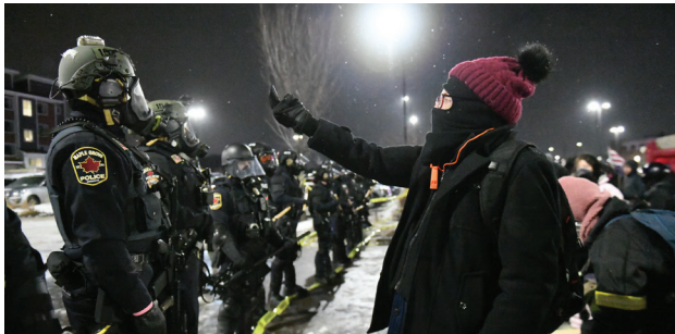
Un manifestante encara a una línea de policías antimotines durante una movilización nocturna, mientras las fuerzas de seguridad bloquean el paso en medio de un clima de confrontación y desconfianza.