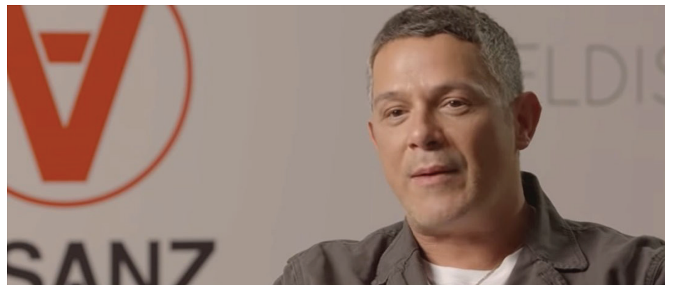
Sanz habla tras superar una depresión hace un par de años que le desenamoró de la música, ganar su vigésimo cuarto Latin Grammy con su disco '¿Y ahora qué?' y esbozar de nuevo una sonrisa.

Sanz se expone aquí como nunca, desde sus inicios con el pelo cardado en el grupo "heavy" de su barrio, su aprendizaje flamenco o