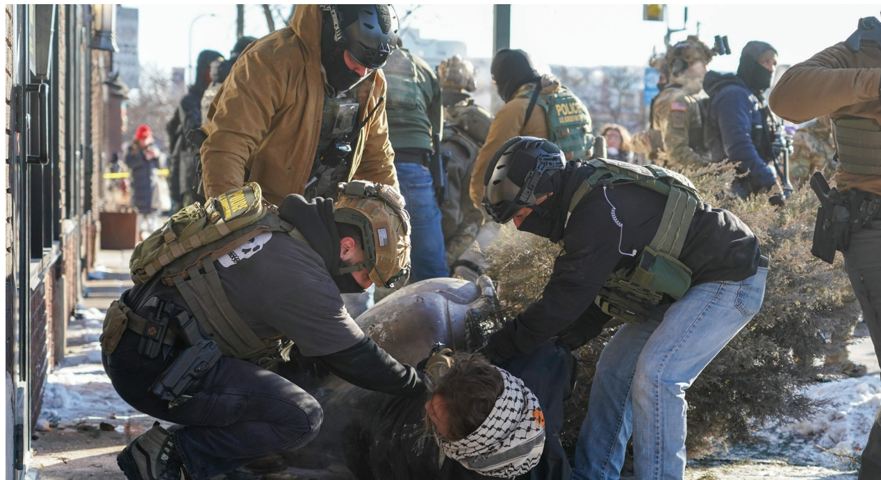
Agentes federales someten a un manifestante durante una redada, en una imagen que ha generado fuertes críticas por el uso de fuerza desproporcionada.

Según reconstrucciones publicadas en los últimos días, el hecho ocurrió el 24 de enero de 2026 en el sur de Minneapolis, en el contexto de una operación federal ampliada —“Operation Metro Surge”— que desde diciembre ha llevado a miles de agentes a la zona y ha generado una escalada de tensión con autoridades locales y residentes.