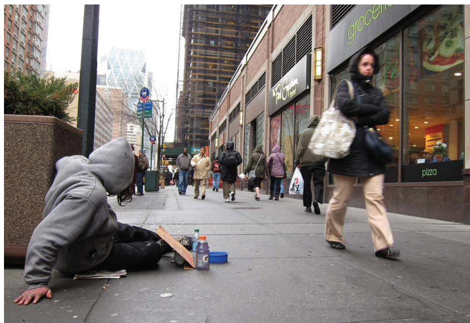
La Sociedad de Asistencia Legal y la Coalición para las Personas sin Techo culparon a las "décadas de fallas sistémicas" de la ciudad de Nueva York las muertes de al menos diez personas sin hogar como resultado de la tormenta invernal y las gélidas temperaturas que están afectando al noreste del país.

"Si bien la ciudad puede estar tomando medidas ahora, décadas de fallas sistémicas no se pueden revertir con unos pocos días de trabajo comunitario ni con autobuses con calefacción. Cuarenta años de mala gestión de las personas sin hogar y del sistema de albergues no se pueden revertir con una sola respuesta de emergencia", afirmaron.